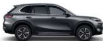
VOLCANIC GRAY (H29)