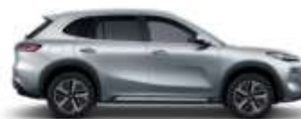
CLOUDVEIL SILVER (H33)