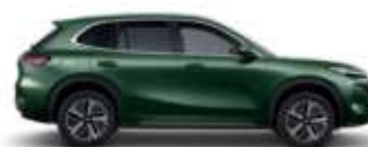
JUNGLE GREEN (H31)