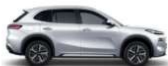
ALPINE WHITE (H32)