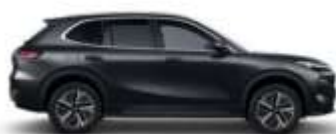
POLAR BLACK (H28)