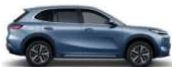
GLACIER BLUE (H30)